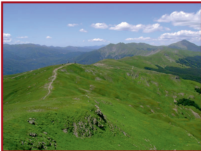
Veduta del Passo della Croce Arcana

il tratto appenninico tra Modena e Pistoia corrispondeva alla romana Mutina Pistoria, che i longobardi riattarono per collegare la Longobardia Maior alla Tuscia, facendo perno sulla abbazia regia di Nonantola e il gastaldato pistoiese. E' su questo tratto che il viandante ed il pellegrino incontravano Cutigliano dopo aver attraversato il Passo della Croce Arcana.