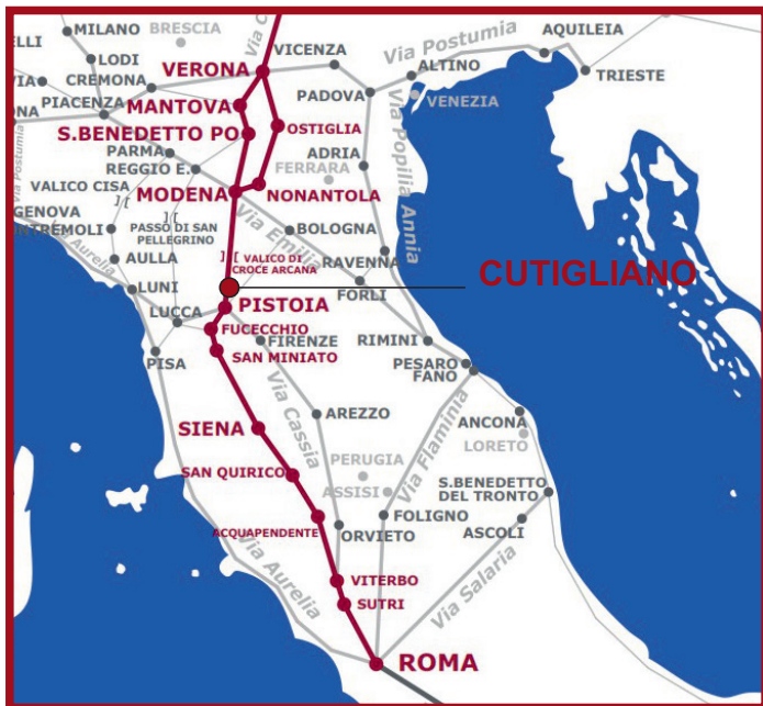
Tracciato della Via Romea Nonantolana (in AA.VV. La Via Romea Imperiale, Mantova Modena, Pistoia. Sulla strada dei sovrani germanici, storia arte identità , Settegiorni Editore, Pistoia

La VIA ROMEA IMPERIALE è una direttrice viaria medievale, che avvalendosi di cospicui tratti della originaria rete stradale romana, ripristinata in modo sostanziale sotto i regni longobardi e carolingio, plausibilmente costituì la via più breve e tra le meglio organizzate per collegare le città del Sacro Romano Impero all'Urbe, il cuore germanico dell'Europa al fulcro della cristianità.